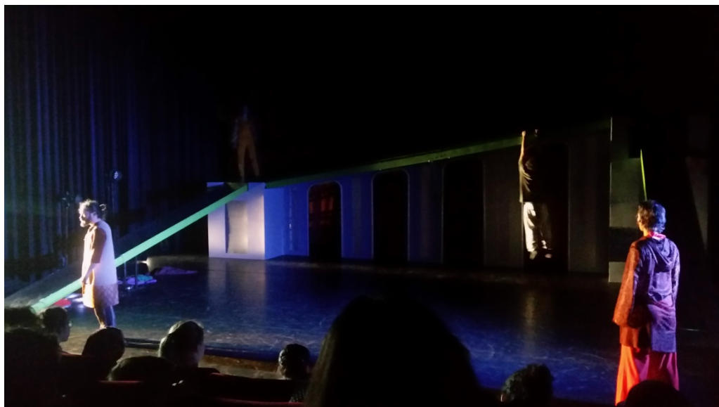
Conny wordt gedood door Laila's vader