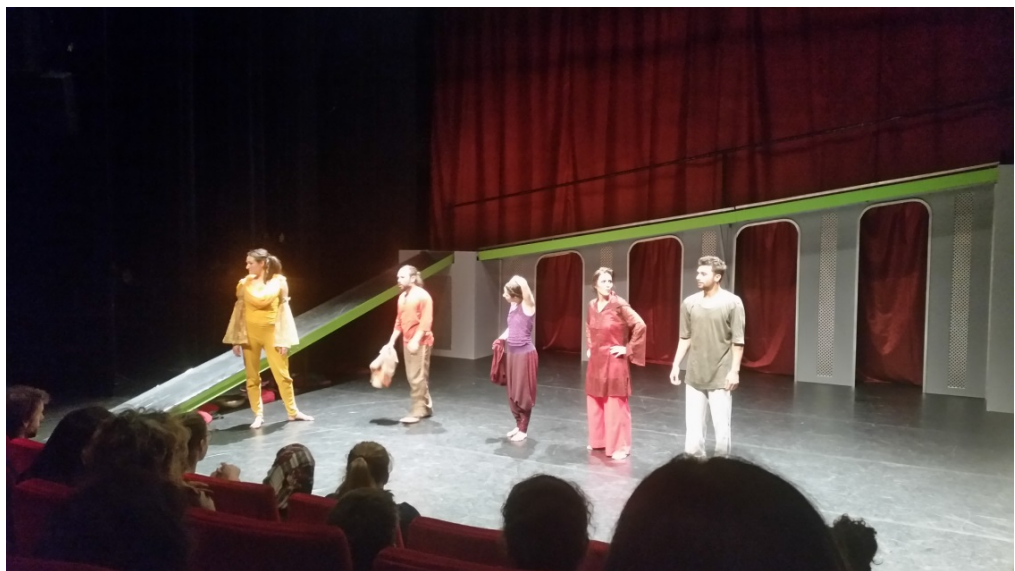
Spelers zoeken samen met publiek naar alternatief einde